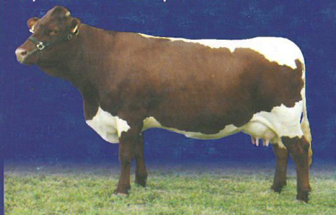
šampiónka pinzgauského plemena AX 2005