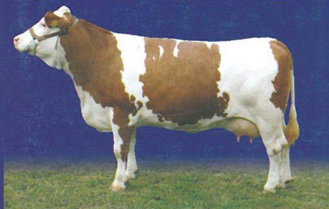
šampiónka strakatého plemena AX 2005