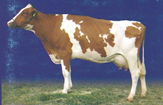
šampiónka holsteinského plemena AX 2005