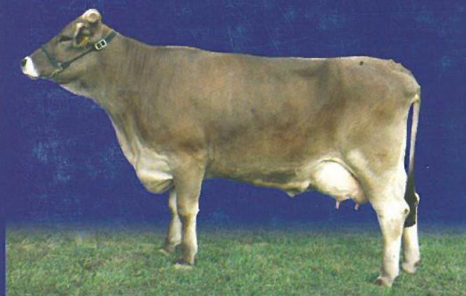
šampiónka braunvieh plemena AX 2005